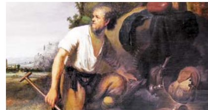
Paràbola del tresor amagat (1630) de Rembrandt. Museu de Belles Arts de Budapest (Hongria)