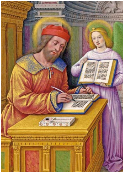
Miniatura de sant Mateu de les Grandes Heures d'Anne de Bretagne (1503-1508) . Biblioteca Nacional de París (França)

C omencem avui un nou cicle de catequesis: la passió per l'evangelització, és a dir, el zel apostòlic. Es tracta d'una dimensió vital per a l'Església: la comunitat dels deixebles de Jesús de fet neix apostòlica, neix missionera, no proselitista. I avui voldria començar amb un episodi evangèlic: la crida de l'apòstol Mateu (cf. Mt 9,9-13).