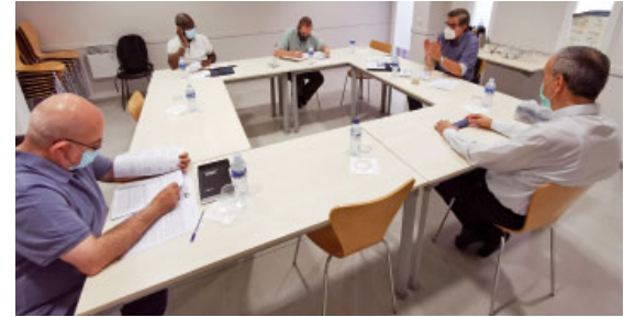
La reunió d'arxiprestos va tenir lloc a la Casa de l'Església

Per altra banda, els dies 23 i 24 de setembre estaven previstes les jornades de formació del clergat a l'Acadèmia Mariana-Casa de l'Església. El tema central va ser la parròquia i la seva renovació. També estava prevista una ponència sobre la catequesi.