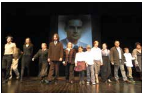
Al Teatre Municipal de Balaguer, el 24 febrer de 2013