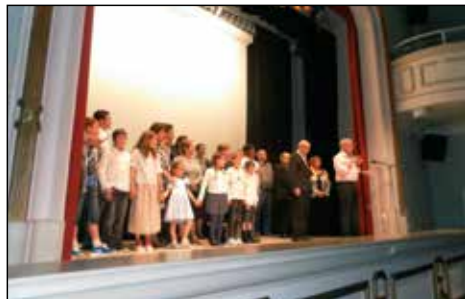
Representació al Teatre de la Mariana de Lleida, 1 juny 2014.