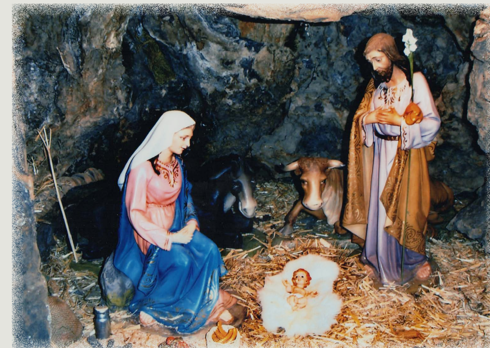
Pessebre Germanetes dels Pobres