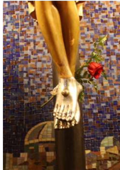
Portada: Imagen del Santo Cristo del Crucifijo de la Parròquia del Carme de Lleida. Foto portada: Anna Maria Gaya. Detalle Pies Cristo: Núria M. Torrebella.

Como presidente, y en nombre de toda la junta directiva os invito a asistir y participar de estas charlas y vivir activamente la Cuaresma 2015 de Lleida.