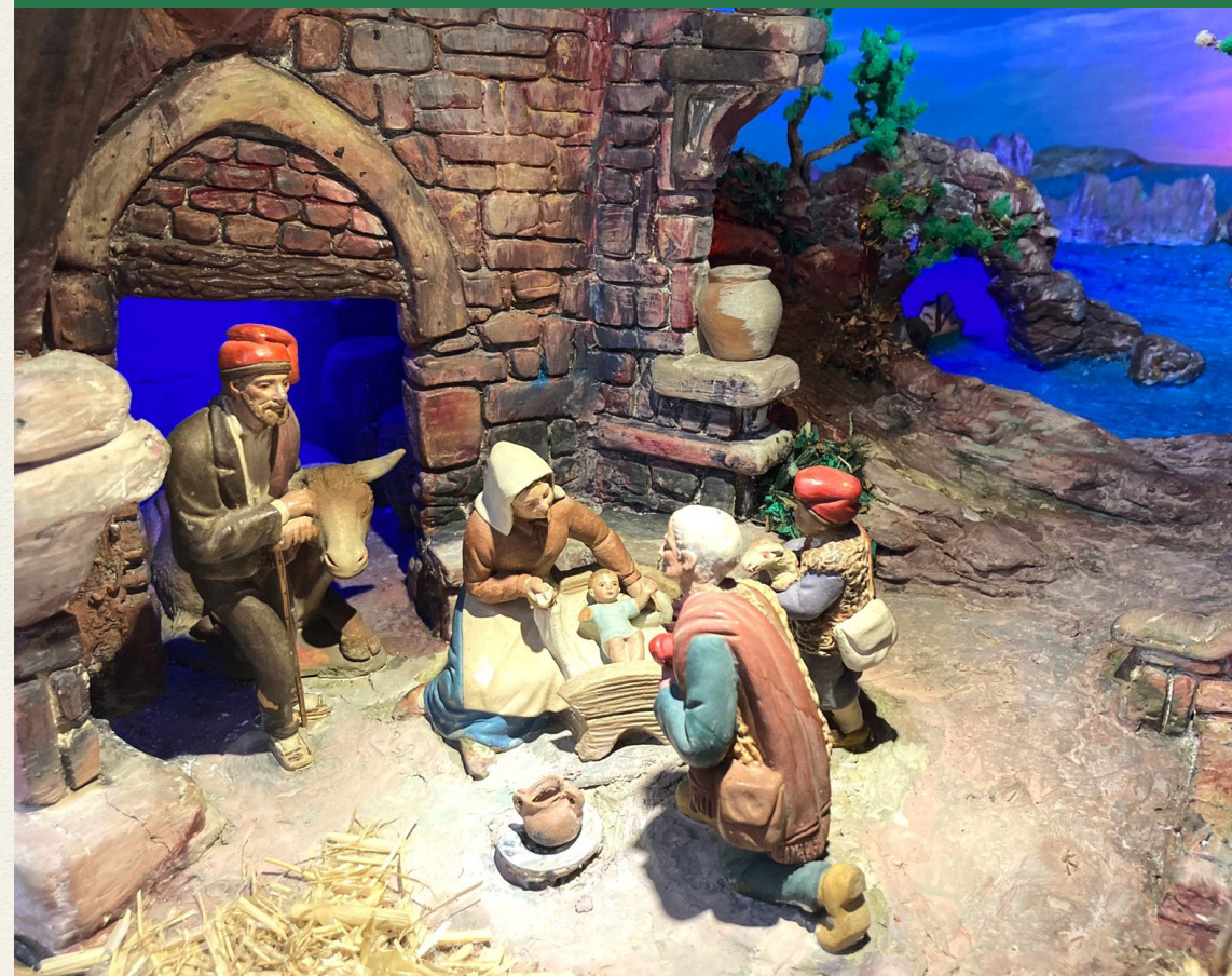
Diorama del Naixement, Escola Catalana, autor desconegut, any 1978. Restaurat per Francisco Vicente, any 2023