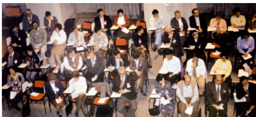
Sessions de treball al Casal Borja de Sant Cugat del Vallès.