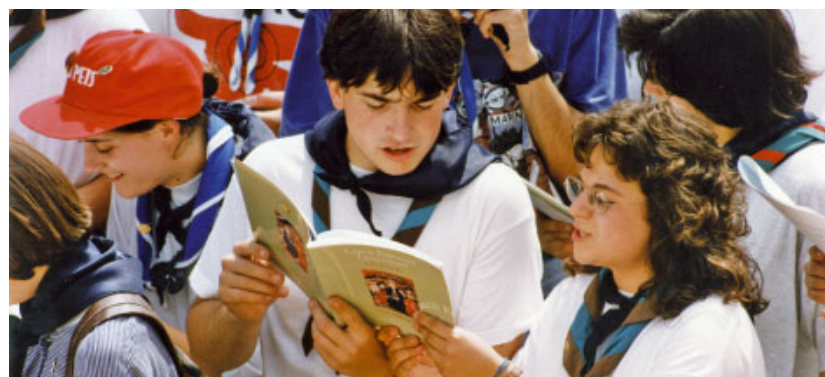
Joves participant en l'acte de cloenda del Concili a l'amfiteatre romà de Tarragona el dia 4 de juny de 1995.