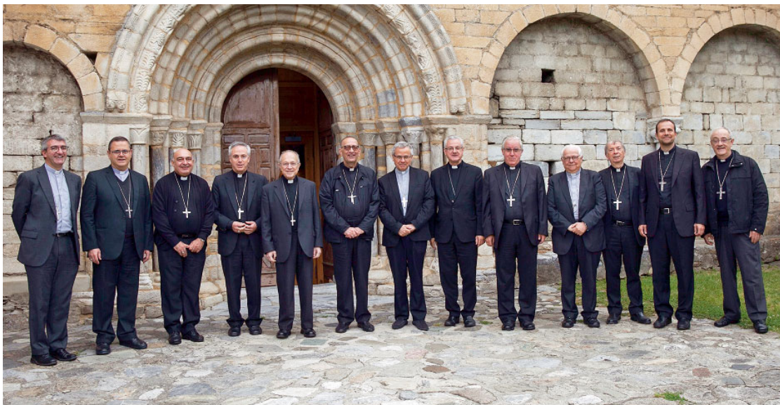
Els actuals bisbes de les diòcesis amb seu a Catalunya en una imatge de la reunió de la Tarraconense celebrada a Salardú, el passat mes de juliol.

El concili fou clausurat solemnement a la catedral de Tarragona el 4 de juny de 1995. En compli-