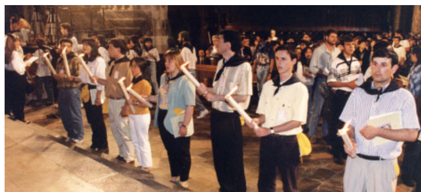
Moment de la cloenda del Concili a l'interior de la Catedral de Tarragona.