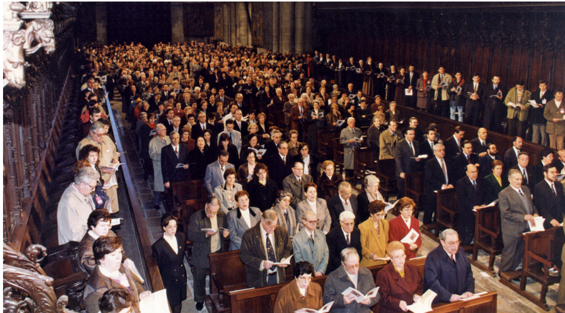
Imatge de la inauguració del Concili Provincial Tarraconense que va tenir lloc el 21 de gener de 1995, a la Catedral Basílica Metropolitana i Primada de Santa Tecla.