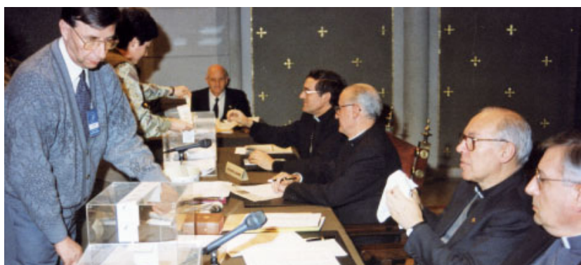
Obertura de les urnes després de les votacions dels temes.