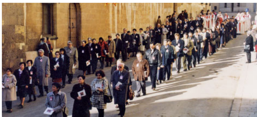
Processó pels carrers de Tarragona. La participació de laics va ser molt important i generosa.