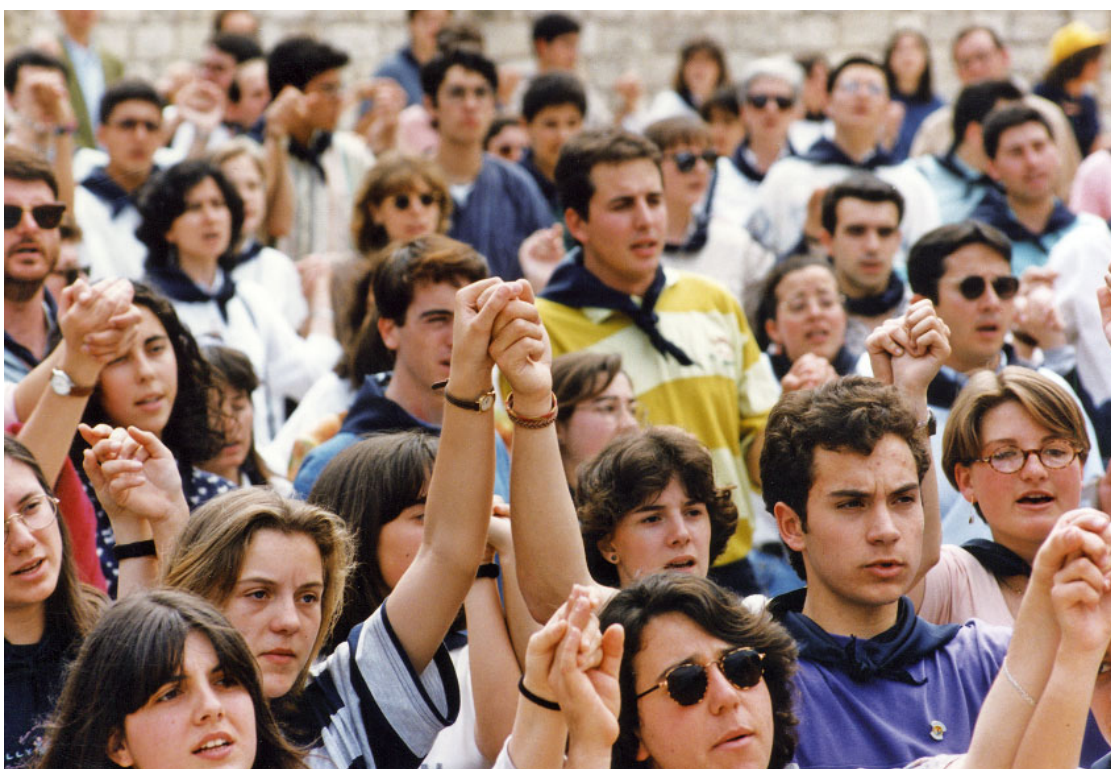
Un grup de joves participa a l'acte de cloenda del Concili Provincial Tarraconense, celebrat el 4 de juny de 1995.

Contemplant els seus documents i resolucions, hom s'adona de la seva profunda actualitat. A la llum de l'Evangelí i de l'escolta de la Paraula de Déu, anunciar l'Evangelí a la nostra societat, amb una sol·licitud especial pels pobres, i en un marc d'unitat pastoral de les nostres Esglésies, ha de ser el pernil o el pal de paeller de l'Església d'avui. Per aquest motiu, ens trobem en plena fase de recepció del Concili Provincial de 1995. Amb les degudes condicions d'universalitat de temps i d'espai, la recepció ha d'anar originant un veritable «consensus fidelium»,