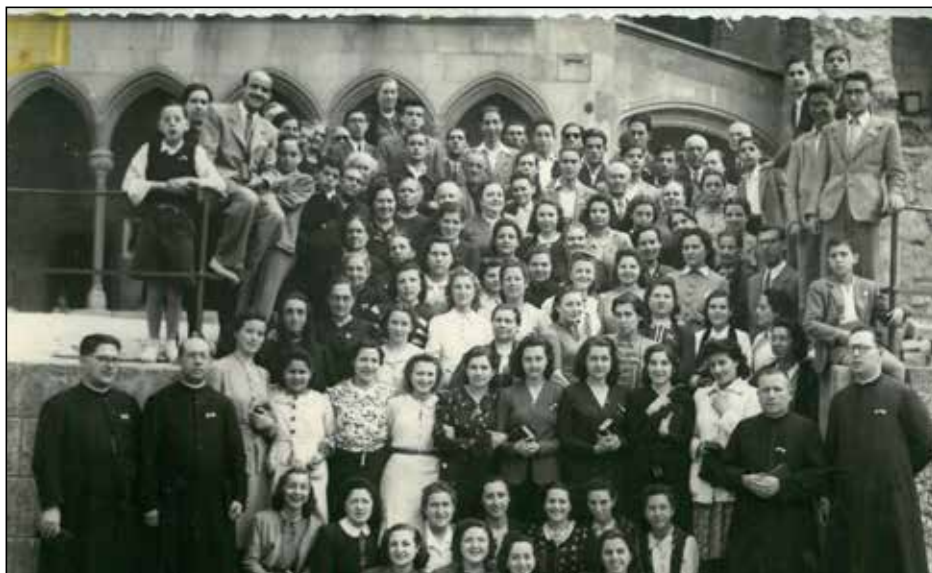
Tradicional foto de família dels primers anys de la Romeria a la Muntanya de Montserrat

Els lleidatans, amarats de religiositat i de patriotisme, han anat fent la vinculació amb el Santuari. Les romeries a Montserrat han estat sempre una vivència constant. No han calgut grans esforços per mobilitzar els