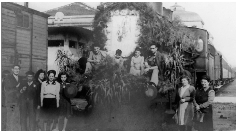
Les primeres Romeries fins els anys 60 calia agafar el tren de Lleida fins l'estació de Monistrol

Després de molts anys d'haver-se establert a Lleida, la nostra Confraria, l'any 1946 començà una nova etapa en les seves activitats. Durant aquest temps hem tingut el goig de veure com la devoció a la nostra Patrona ha anat arrelant en les diferents estructures de la nostra ciutat, especialment en el dia de la seva festa, que es volca materialment a venerar-la en el seu altar de la Catedral. Una altra de les activitats destacades és la Romeria a Montserrat que cada any celebra la Confraria i que aquest any commemora el 75è aniversari de la primera Romeria organitzada per la Confraria.