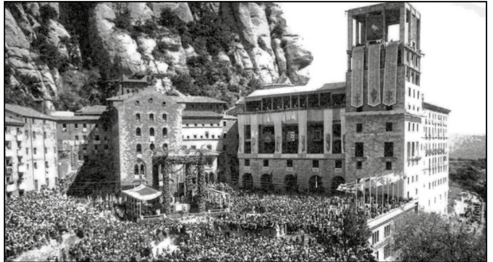
La cerimònia d'Entronització de la Mare de Déu de Montserrat tingué lloc el 27 d'abril de 1947.