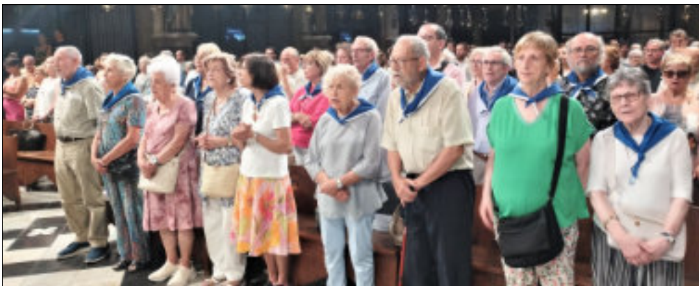
El President amb membres de Junta i confreres lleidatans van ocupar els primers bancs de la basílica a l'Eucaristia.