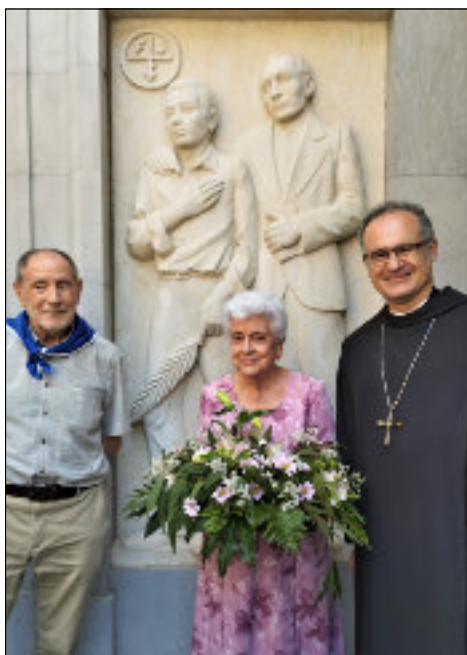
Ofrena de flors al relleu del Beat Francesc