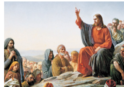
Sermó de la muntanya (1877), de Carl Heinrich Bloch