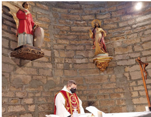
La celebració va finalitzar amb el cant dels Goigs a Sant Vicenç.