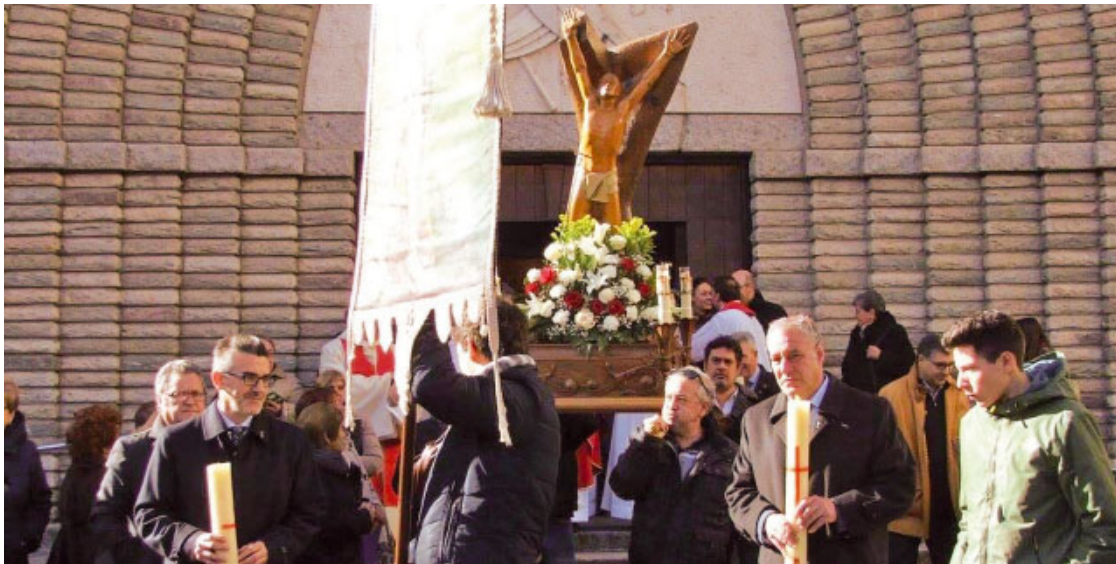
Imatge d'arxiu de la Festa de Sant Sebastià del Pont de Suert

F ou un màrtir romà del segle III. Nascut l'any 256 a la Gàl·lia Narbonense i mort el 287 a Roma. Sant Ambrós, bisbe de Milà (340-397), fou el primer que parlà del sant, emperò el seu relat popularitzat no era verídic. De sant Sebastià hi ha poca informació sobre la seva vida. En trobem informació dins de Depositio martyrum , un llistat de màrtirs en el còdex il·lustrat més antic, Cronologia del 354 . On se'ns glossa que fou enterrat a Via Àpia.