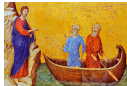
La crida dels apòstols Pere i Andreu (1308), de Duccio di Buoninsegna. Galeria Nacional d'Art, Washington (EUA)