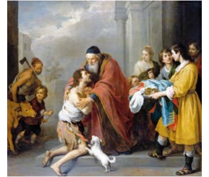
El retorn del fill pròdig (1667-1670) de Bartolomé Murillo. Galeria Nacional d'Art, Washington DC (EUA)