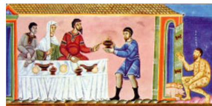
Llàtzer i Epuló, detall de la miniatura del Codex Aureus d'Echternach (1035-1040) . Museu Nacional Germànic, Nuremberg (Alemanya)

Un dels gran problemes de la riquesa és que el ric s'obsessiona amb els diners i no té ni temps ni ganes de preocupar-se dels altres i de les seves necessitats, per tant no solament deixen d'estimar Déu sinó també el proïsme. Ho veiem a les lectures d'avui. Un cop més, Amós denuncia els rics: S'estiren en llits de marfil..., mengen els anyells més tendres, improvisen al so de l'arpa, beuen vi en grans copes, s'ungeixen amb els perfums . Però el pitjor és que no els fa cap pena el desastre de les tribus de Josep , és a dir, no es preocupen del poble i es creuen segurs en la seva riquesa quan dins de pocs anys caurà el desastre sobre tots ells. Però als rics això no els preocupa. I això que també ells rebran el càstig: Seran els primers en les files dels deportats; així s'acabarà l'orgia dels vividors .