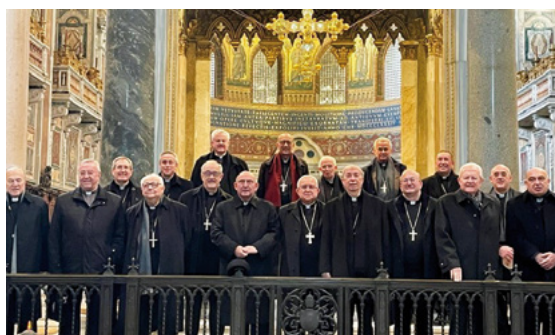
Foto de família dels bisbes a la basílica de Sant Joan del Laterà