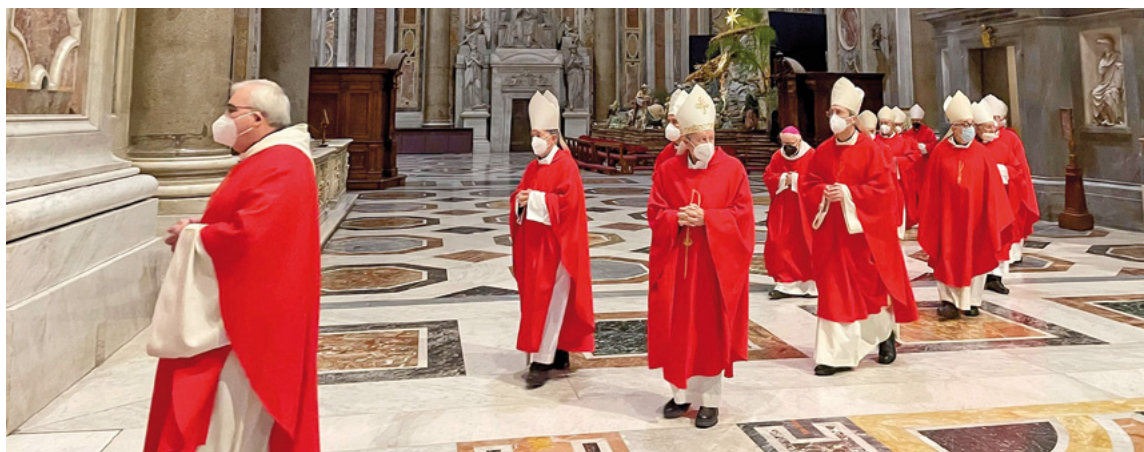
Els bisbes participants en la visita ad limina van celebrar l'Eucaristia el primer dia a la tomba de sant Pere

cull d'imatges de les jornades de treball, comunió i pregària entre els bisbes de les províncies eclesiològiques de Tarragona, Barcelona i València.