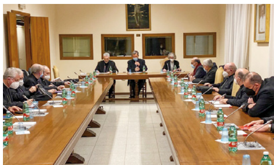
Els bisbes també van participar en reunions en diferents dicasteris com aquesta al Sínodo dels Bisbes