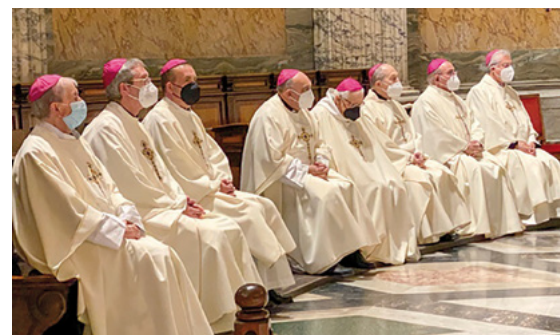
El dijous 13 de gener, els bisbes van celebrar l'Eucaristia a Sant Pau Extramurs