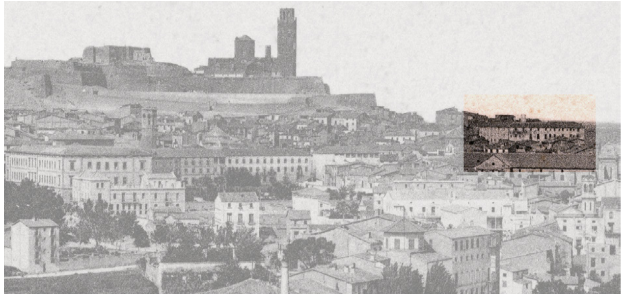
Començament del s. XX, extrem superior dret el perfil del Seminari, fins al 1767 edifici dels Jesuïtes

Durant aquest període per al Seminari fou un moment esplendorós, època que continuà amb increment de seminaristes i vocacions. Un fruit d'això és