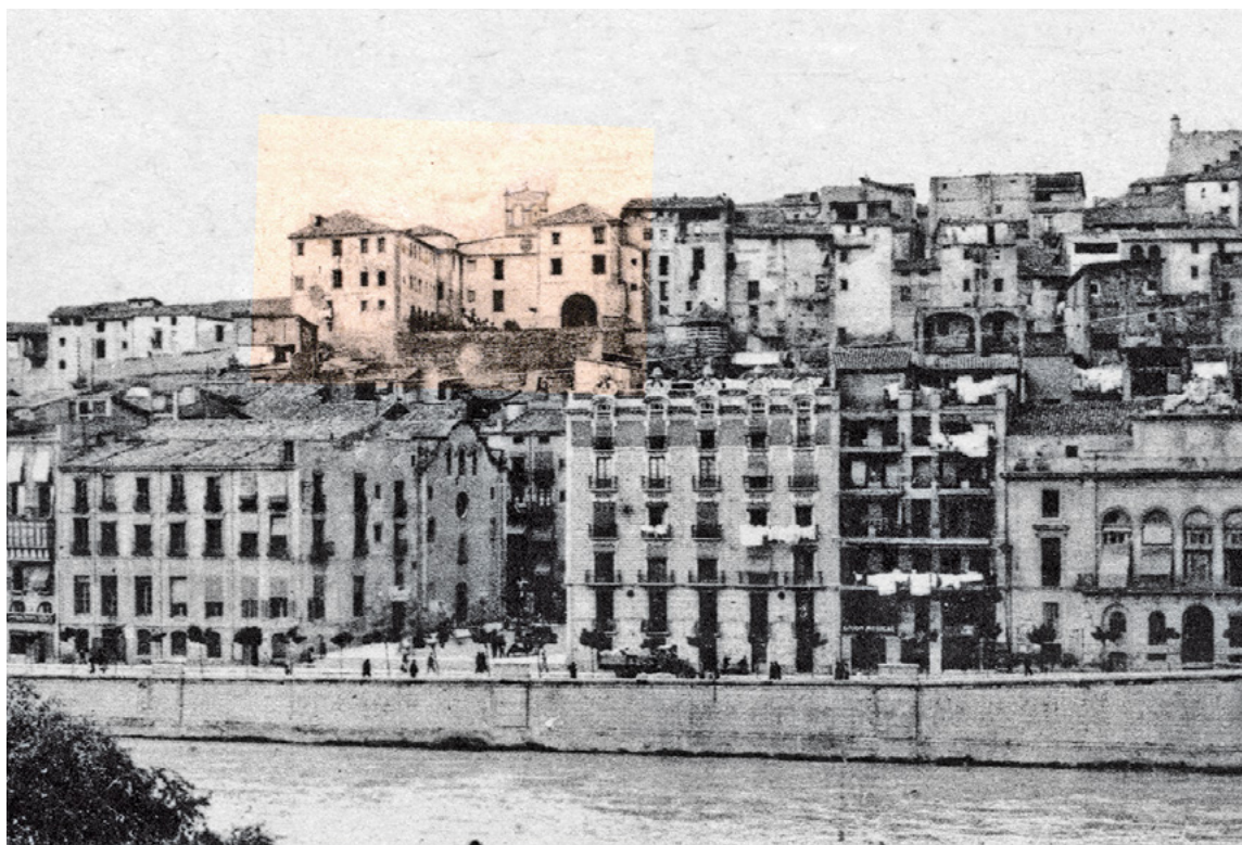
Vista de Lleida des de Cap-Pont. A la part superior es pot observar el que fou Col·legi dels Jesuïtes

El segle XIX ve marcat per la caiguda de l'Antic Règim i l'assumpció del liberalisme i les guerres carlines en contra del nou ordre esta-