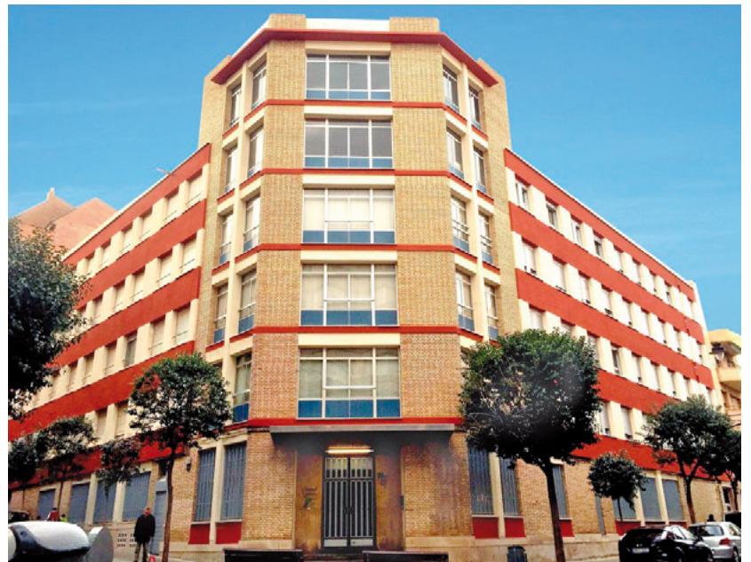
Seminari al carrer Canonge Brugulat