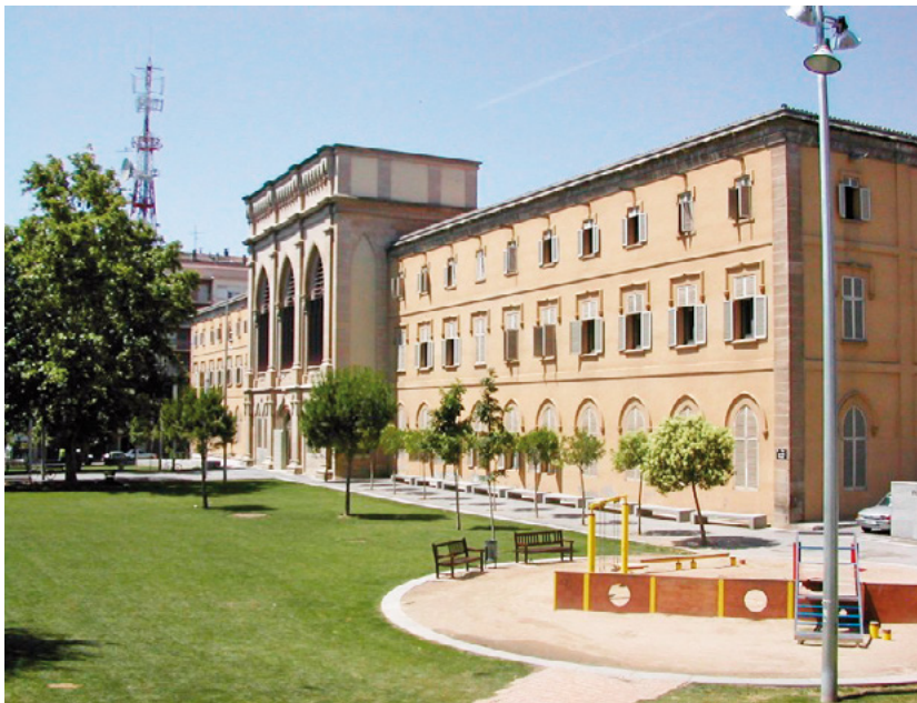
L'actual seu de la UdL va acollir el Seminari entre 1893 i 1978

Materials extrets dels volums III i IV de les Arrels Cristianes de Lleida . Lleida, Bisbat de Lleida, Pagès Editors, 2007.