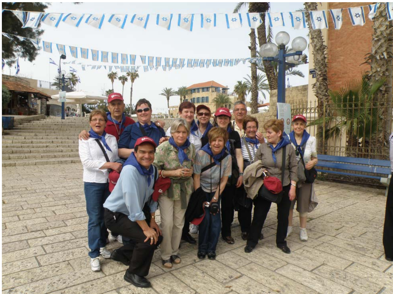
L'Alta Ribagorça peregrina a Terra Santa