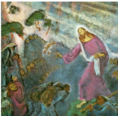
Jesús predicando la Bona Nova. Pintura d'Slatko Sulentik, Museu d'Art Modern, Ciutat del Vaticà

Con muchas parábolas parecidas les exponía la Palabra, acomodándose a su entender. Todo se lo exponía con parábolas, pero a sus discípulos se lo explicaba todo en privado.