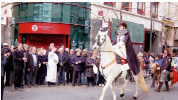
Festa de Sant Antoni a Lleida