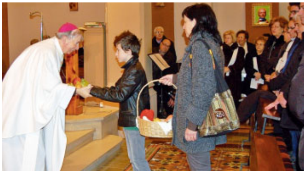
Festa de Sant Antoni a Lleida

Sarroca de Lleida també va celebrar una gran diada en honor a Sant Antoni dins del seu programa de la Festa Major. Els actes van començar amb el repic de campanes i tot seguit es va celebrar la missa en honor aquest sant, amb la veneració de la relíquia i les ofrenes a l'entorn de Jesús ressuscitat per part dels representants del municipi. Després es va fer la processó pels carrers i per finalitzar l'acte litúrgic, representants de l'associació de dones van vendre les coques que havien estat beneïdes.