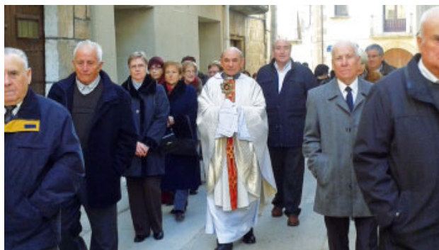
Festa de Sant Antoni a Sarroca