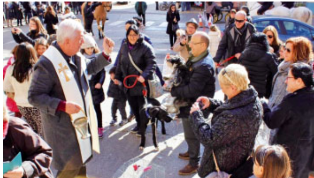
Festa de Sant Antoni a Alcarràs