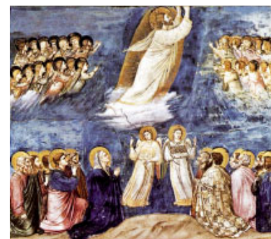
Ascensió del Senyor (1305-1306) de Giotto. Fresc de la capella dels Scrovegni. Pàdua (Itàlia)

Tot i la pregunta decebedora ( restablireu ara la reialesa d'Israel? ), confirma Jesús els deixebles en la missió: Rebreu una força —l'Esperit Sant— que us farà testimonis meus fins als límits més llunyans de la terra.