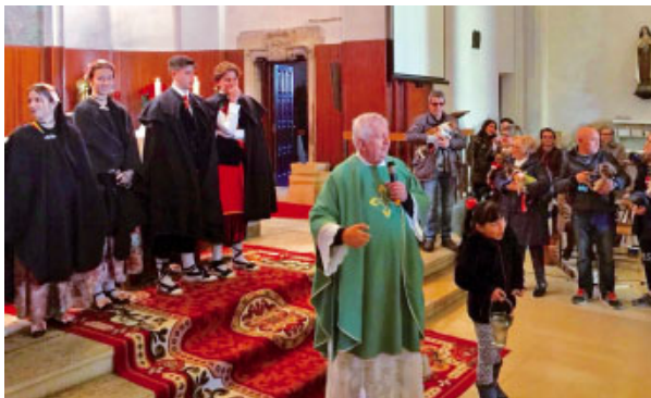
Festa de Sant Antoni a Alcarràs