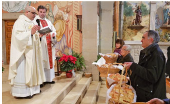
Festa de Sant Antoni a Castellans