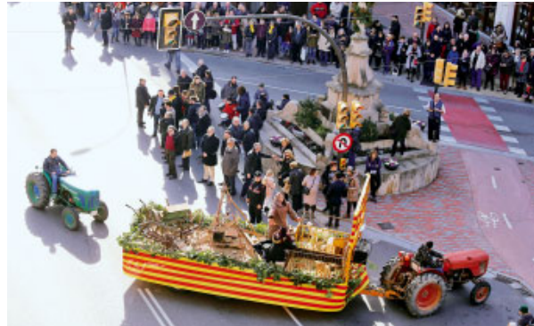
Els Tres Tombs a Lleida