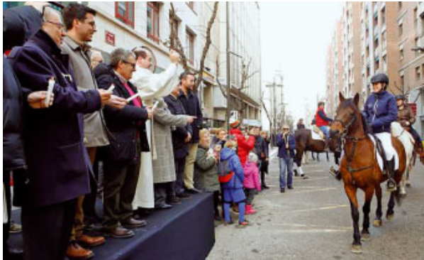
Els Tres Tombs a Lleida