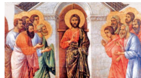
Maestà, de Duccio di Buoninsegna (s. XIV), Museo dell'Opera, Siena (Itàlia)

E l llibre dels Fets dels Apòstols s'estructura sobre l'encàrrec del Ressuscitat als Apòstols: Quan l'Esperit Sant vindrà sobre vosaltres, rebreu una força que us farà testimonis meus a Jerusalem, a Judea, a Samària i fins als límits més llunyans de la terra (1,5s).